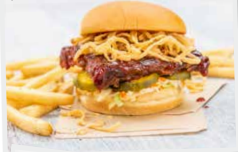
Road House Rib Sandwich