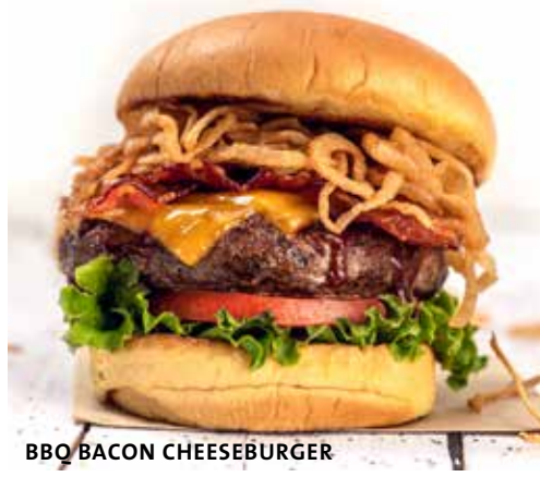
BBQ BACON CHEESEBURGER