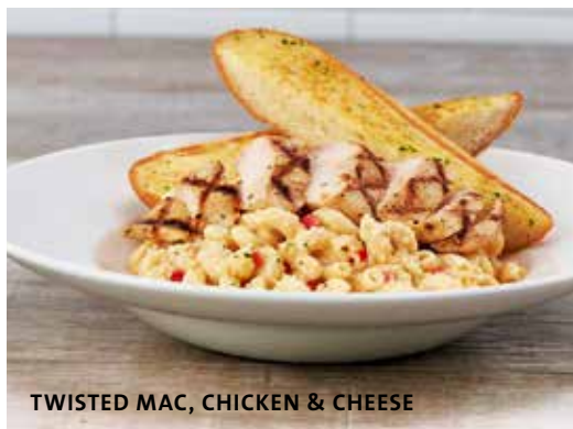
TWISTED MAC, CHICKEN & CHEESE

Mantemos informações sobre alergias para todos os itens do menu. Fale com o seu server para obter mais detalhes. Se sofre de alergia alimentar, certifique-se de que seu server está ciente no momento do pedido. † Contém nozes ou sementes. *Esses itens contêm (ou podem conter) ingredientes crus ou mal cozidos. Consumir hambúrgueres, carnes, aves, frutos do mar, mariscos ou ovos crus ou mal cozidos pode aumentar o risco de doenças de origem alimentar, especialmente se você tiver certas condições médicas. # (GF) Sem glúten, (V) Vegetariano, (VG) Vegano. A Estes pratos podem ser modificados para opção Sem Glúten, Vegetariana ou Vegana. (GF-A) Sem glúten disponível, (V-A) Vegetariano disponível, (VG-A) Vegano disponível. Por favor, fale com o seu server para organizar quaisquer necessidades dietéticas.