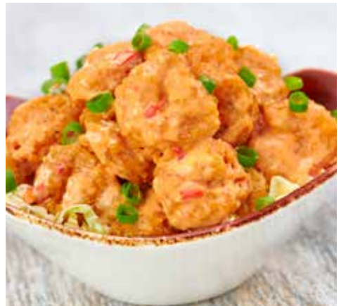
ONE NIGHT IN BANGKOK SPICY SHRIMP™

Tomate marinado em vinagre balsâmico e manjeriço fresco, coberto com queijo Romano ralado. Servido em pão artesanal torrado e com lascas de parmesão à parte.* Δ €13.95