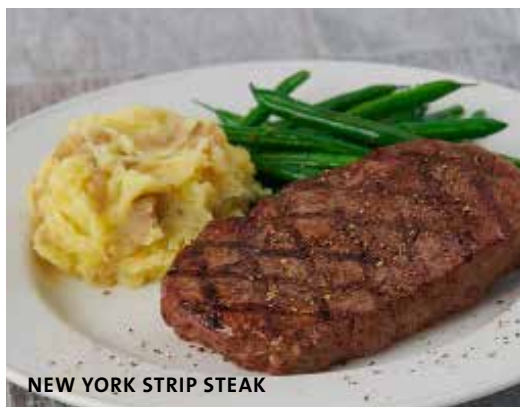
NEW YORK STRIP STEAK

Usufrua ao estilo Surf n' Turf com o One Night In Bangkok Spicy Shrimp™ (coberto com camarões salteados) por mais €7.95