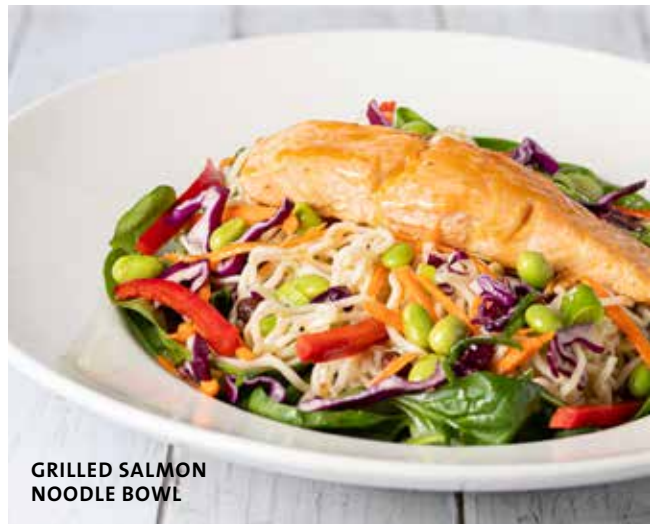
GRILLED SALMON NOODLE BOWL