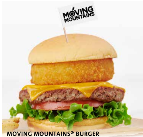
MOVING MOUNTAINS® BURGER

Mantemos informações sobre alergias para todos os itens do menu. Fale com o seu server para obter mais detalhes. Se sofre de alergia alimentar, certifique-se de que seu server está ciente no momento do pedido. † Contém nozes ou sementes. *Esses itens contêm (ou podem conter) ingredientes crus ou mal cozidos. Consumir hambúrgueres, carnes, aves, frutos do mar, mariscos ou ovos crus ou mal cozidos pode aumentar o risco de doenças de origem alimentar, especialmente se você tiver certas condições médicas. † (GF) Sem glúten, (V) Vegetariano, (VG) Vegano. Δ Estes pratos podem ser modificados para opção Sem Glúten, Vegetariana ou Vegana. (GF-A) Sem glúten disponível, (V-A) Vegetariano disponível, (VG-A) Vegano disponível. Por favor, fale com o seu server para organizar quaisquer necessidades dietéticas.