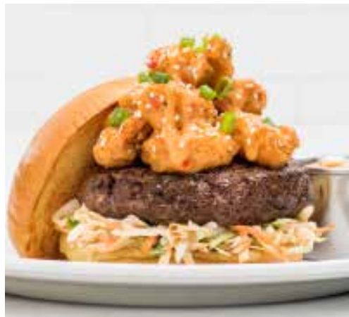
SURF & TURF BURGER

Dois hambúrgueres ligeiramente esmagados e empilhados, temperados e grelhados. Com queijo Monterey Jack, jalapeños, alface, tomate e maionese picante.* Δ €18.95