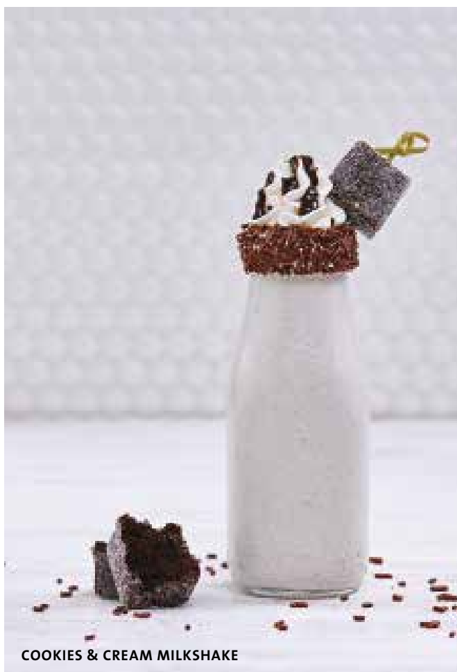
COOKIES & CREAM MILKSHAKE

Mantemos informações sobre alergias para todos os itens do menu. Fale com o seu server para obter mais detalhes. Se sofre de alergia alimentar, certifique-se de que seu server está ciente no momento do pedido. † Contém nozes ou sementes. *Esses itens contêm (ou podem conter) ingredientes crus ou mal cozidos. Consumir hambúrgueres, carnes, aves, frutos do mar, mariscos ou ovos crus ou mal cozidos pode aumentar o risco de doenças de origem alimentar, especialmente se você tiver certas condições médicas. # (GF) Sem glúten, (V) Vegetariano, (VG) Vegano. Δ Estes pratos podem ser modificados para opção Sem Glúten, Vegetariana ou Vegana. (GF-A) Sem glúten disponível, (V-A) Vegetariano disponível, (VG-A) Vegano disponível. Por favor, fale com o seu server para organizar quaisquer necessidades dietéticas.