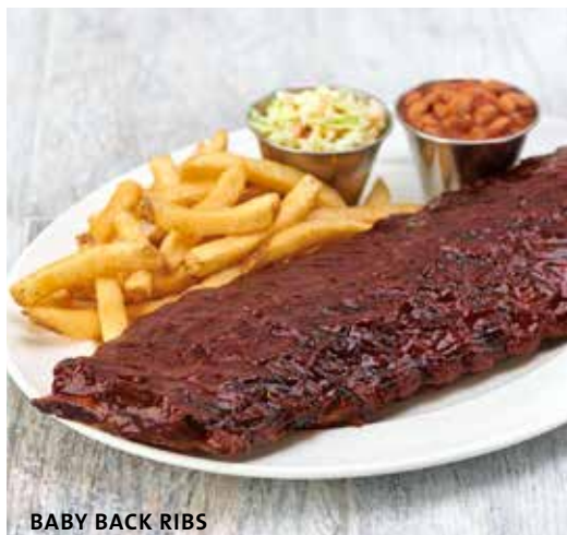
BABY BACK RIBS

Crocantes tiras de frango panadas, servidas com batatas fritas, molho de mostarda e mel caseiro e molho barbecue. €17.95