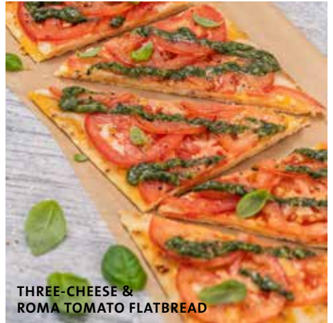
THREE-CHEESE & ROMA TOMATO FLATBREAD