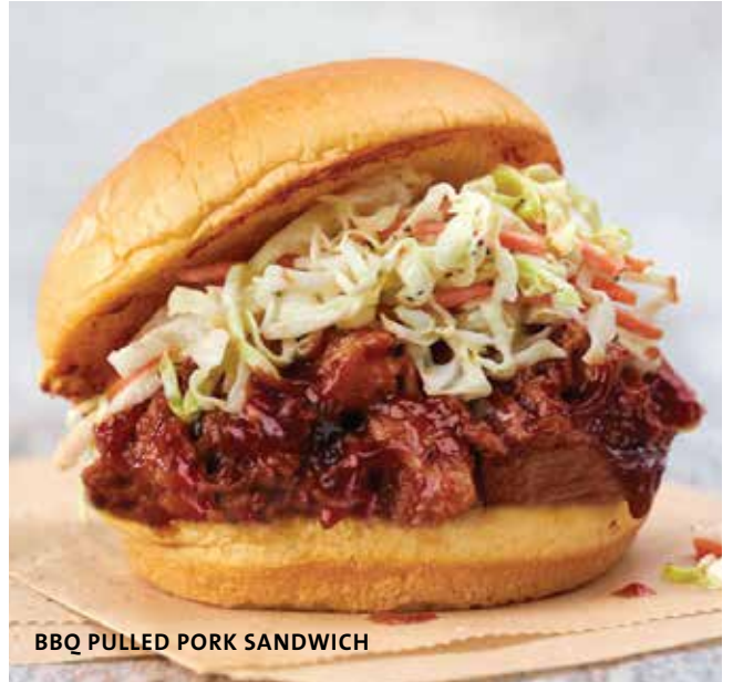
BBQ PULLED PORK SANDWICH

Frango frito envolvido no nosso molho clássico buffalo, servido com alface, tomate, molho ranch, num pão de brioche tostado. €17.95