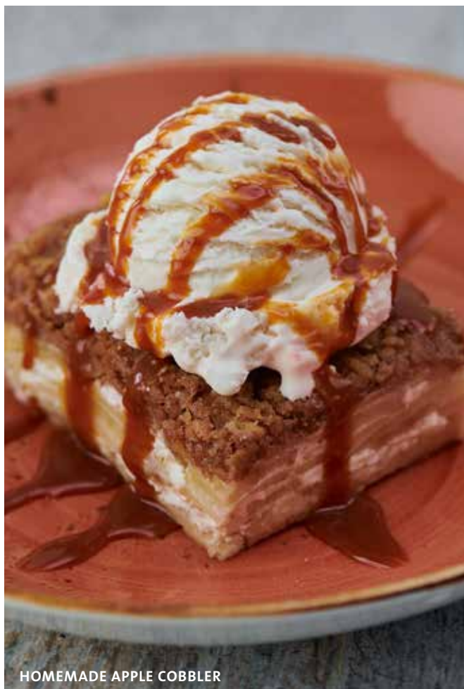
HOMEMADE APPLE COBLER

Gelado de baunilha misturado com chocolate branco e bolachas Oreo, finalizado com chantilly e pequeno brownie caseiro com açúcar. €9.25