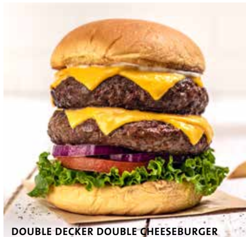
DOUBLE DECKER DOUBLE CHEESEBURGER