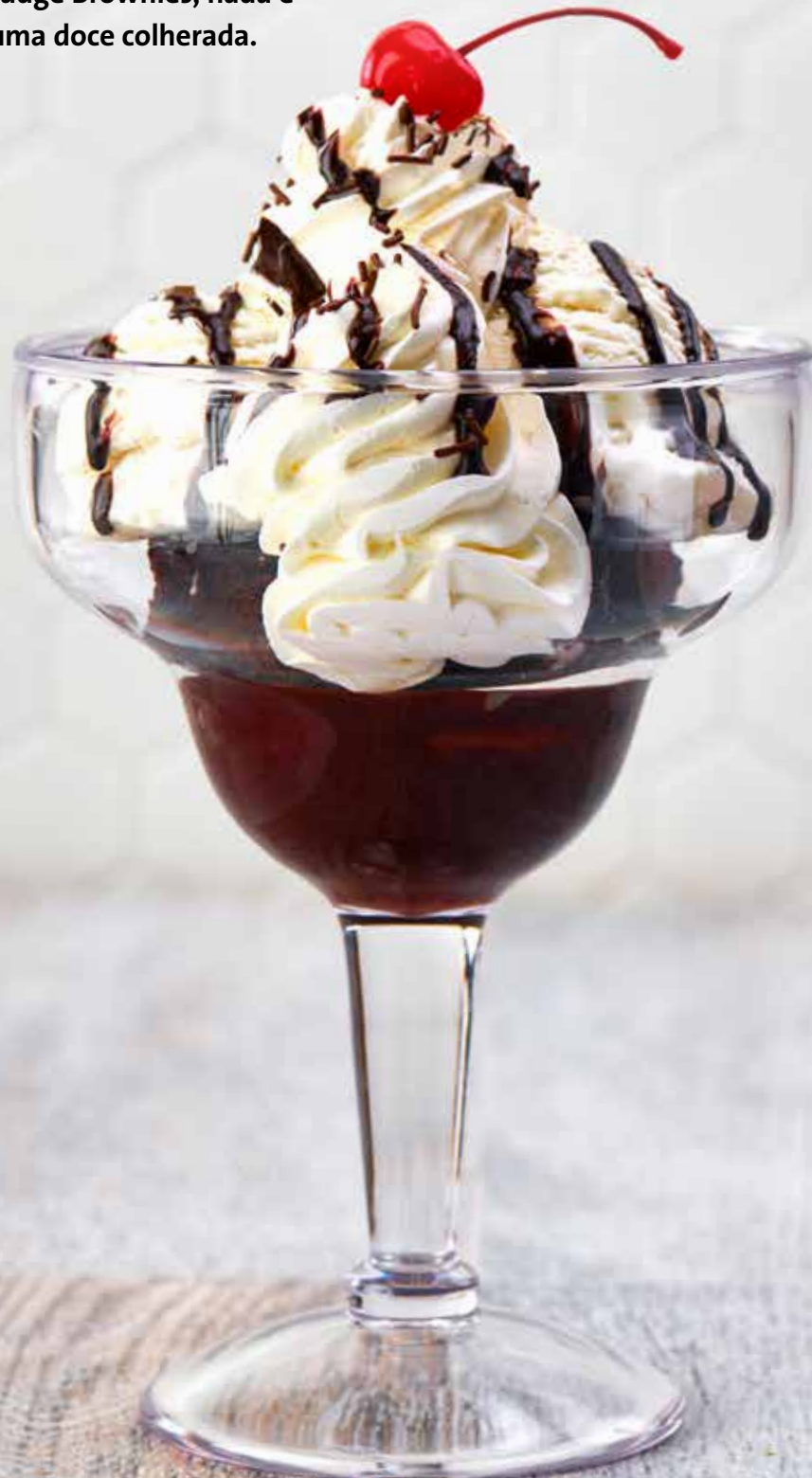
HOT FUDGE BROWNIE

Desde Milkshakes a Hot Fudge Brownies, nada é mais Rock n' Roll do que uma doce colherada.